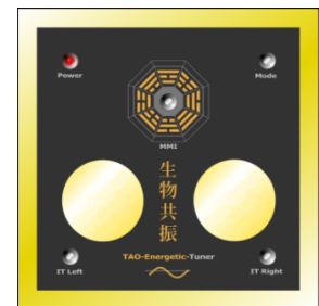
Abb. TAO Energetic Tuner, Multifunktionshardware zum Scannen und Regulieren sowie zur Informationsübertragung.

Die psychophysiologische Ankopplung an das MMI erlaubt u.a. die jeweilige Stress- und Entspannungslage des Klienten zu berücksichtigen und dient wie bereits erwähnt gleichzeitig der funktionalen Kontrolle der Programmabläufe.