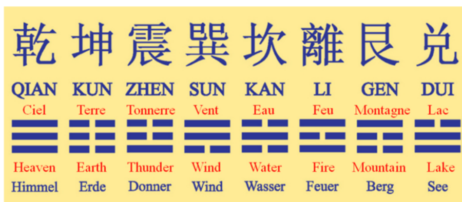
Abb. Die acht Trigramme – Symbole der Natur und Grundlage des I Ging

Sie kann sowohl als eigenständiges Verfahren z.B. von GesundheitsCoaches und Lebensberatern, als auch für den medizinischen Wellness-Bereich eingesetzt werden. Ebenso ist sie eine ideale Ergänzung für Ärzte und Heilpraktiker die bereit sind, neue Wege zu gehen und moderne Informationstechnologien in ihrem beruflichen Umfeld mit einsetzen möchten.