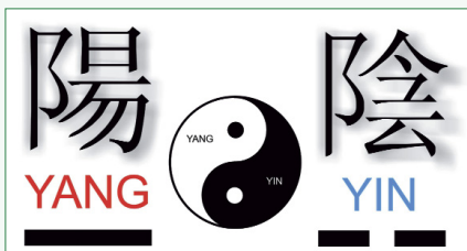
Abb. 1: Die Symbolik von Yin und Yang – Die Strichcodes des Yijing

Gemäß der Schöpfungstheorie des Yijing beinhaltet das Buch der Wandlungen alles, was sich zwischen Himmel und Erde ereignet. Es beschreibt die Welt in 64 Hexagrammen, die aus je sechs Linien (durchgehend = Yang oder unterbrochen = Yin) bestehen. Das Buch gehört zu den ältesten Dokumenten der Menschheit und wird im Allgemeinen als Lebens- und Weisheitsbuch benutzt. Bekannt wurde es bei uns durch Richard Wilhelm, der als erster 1924 eine Übersetzung in deutscher Sprache vorlegte.