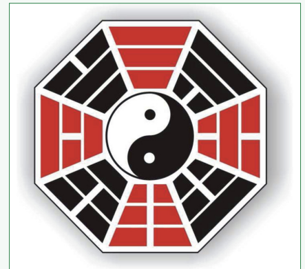
Abb. 2: Hetu-Anordnung der Bagua – Die geistige Ordnung der Trigramme

All diese Methoden liefern entsprechende Hexagramme für die Interpretation einer bestimmten Situation. Für eine moderne medizinische